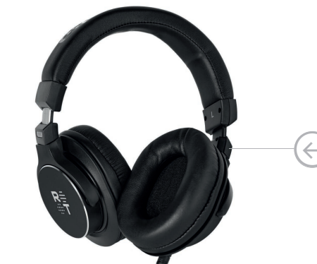
Поворотный механизм амбушюр