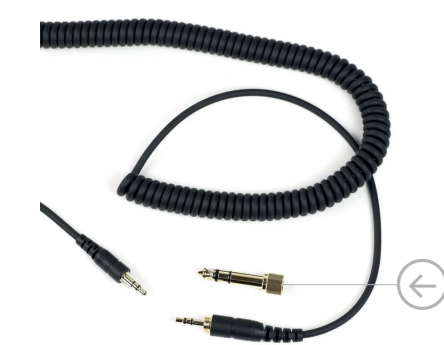
Винтовой штекер для переходника