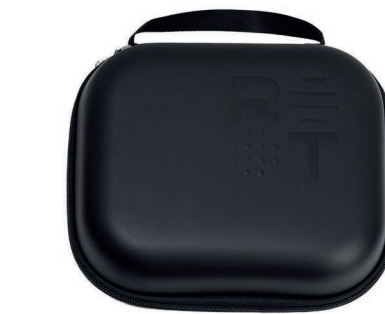
Портативный зарядный кейс