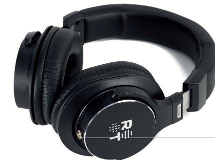
Входной штекер для провода