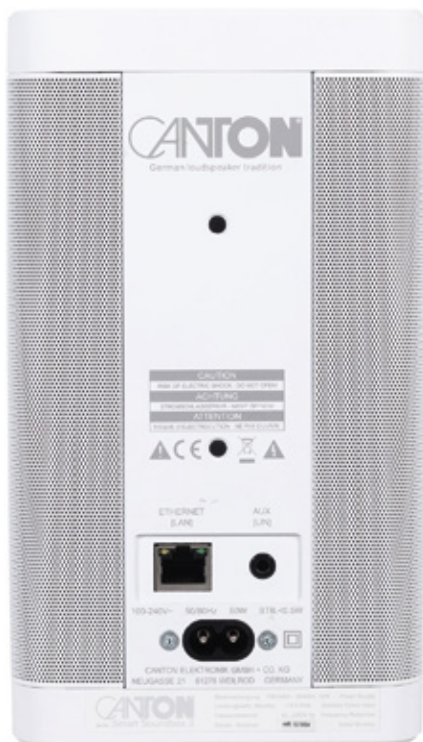
Einmal mit Netzwerk und Stromnetz verbunden, ist die Soundbox sofort einsatzbereit

gängen zu wechseln oder Geräte der Smart-Serie miteinander zu verbinden, muss man dies jedoch direkt am Gerät tun. Dies funktioniert an sich auch sehr gut. Man muss sich lediglich an die sehr empfindlichen Touchknöpfe gewöhnen und sich die dreilettrigen Abkürzungen, welche im gewöhnungsbedürftigen Blau erstrahlen in der Anleitung nachschlagen. Gerade beim ersten Einrichten braucht man etwas Geduld. Beim zweiten Mal wirkt jedoch alles sehr intuitiv. Wer die Soundbox 3 jedoch auf einen Schrank gestellt oder als Atmos-Lautsprecher nutzt, sollte wohl eher die Smart Remote Fernbedienung ausweichen, die zusätzlich erhältlich ist. Getestet haben wir die Smart Soundbox 3 als Stereopaar, also