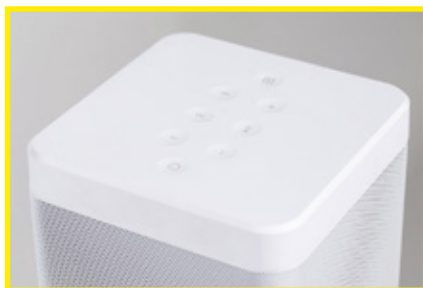
Die unauffälligen Touch-Controls kennen wir bereits von anderen Modellen der Reihe

gängen zu wechseln oder Geräte der Smart-Serie miteinander zu verbinden, muss man dies jedoch direkt am Gerät tun. Dies funktioniert an sich auch sehr gut. Man muss sich lediglich an die sehr empfindlichen Touchknöpfe gewöhnen und sich die dreilettrigen Abkürzungen, welche im gewöhnungsbedürftigen Blau erstrahlen in der Anleitung nachschlagen. Gerade beim ersten Einrichten braucht man etwas Geduld. Beim zweiten Mal wirkt jedoch alles sehr intuitiv. Wer die Soundbox 3 jedoch auf einen Schrank gestellt oder als Atmos-Lautsprecher nutzt, sollte wohl eher die Smart Remote Fernbedienung ausweichen, die zusätzlich erhältlich ist. Getestet haben wir die Smart Soundbox 3 als Stereopaar, also